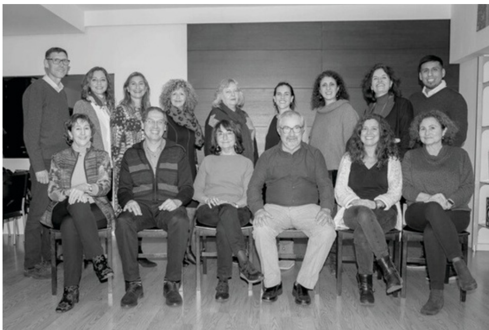
EQUIPO SANT PAU

Nuestro principal objetivo es capacitar a los alumnos para las Intervenciones Sistémicas en contextos no clínicos (Social, Educativo, Sanitario, Judicial, Institucional, etc.), y, muy especialmente, su formación profesional en Terapia Familiar y de Pareja.